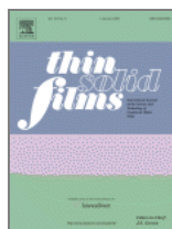
Thin Solid Films