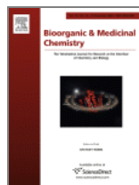
Bioorganic & Medicinal Chemistry