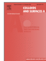
Colloids and Surfaces A: Physicochemical and Engineering Aspects