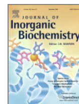
Journal of Inorganic Chemistry